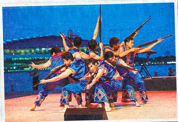
►新加坡福建会馆舞蹈剧场呈献“起舞弄清影”。