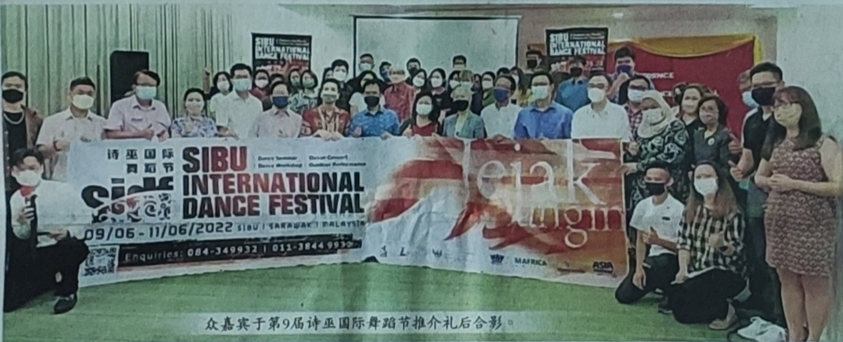
众嘉宾于第9届诗巫国际舞蹈节推介礼后合影。

配合此届国际舞蹈节而举办的舞蹈工作坊于6月10日及11日早上9时30分至11时30分，在常青酒店举行；舞蹈讲座于6月10日及11日下午2时至4时，在常青酒店举行；编导交流会于6月10日晚上10时15分至10时45分在常青酒店进行。至于户外演出于6月11日早上11时30分，在中央市场第3入口进行。