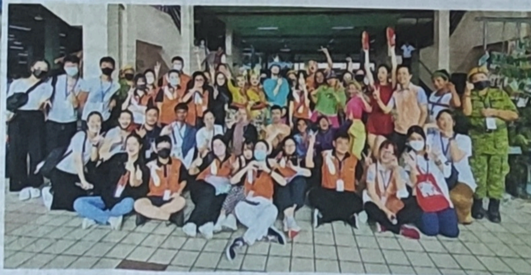
户外演出参与的舞者,工作人员等合摄。