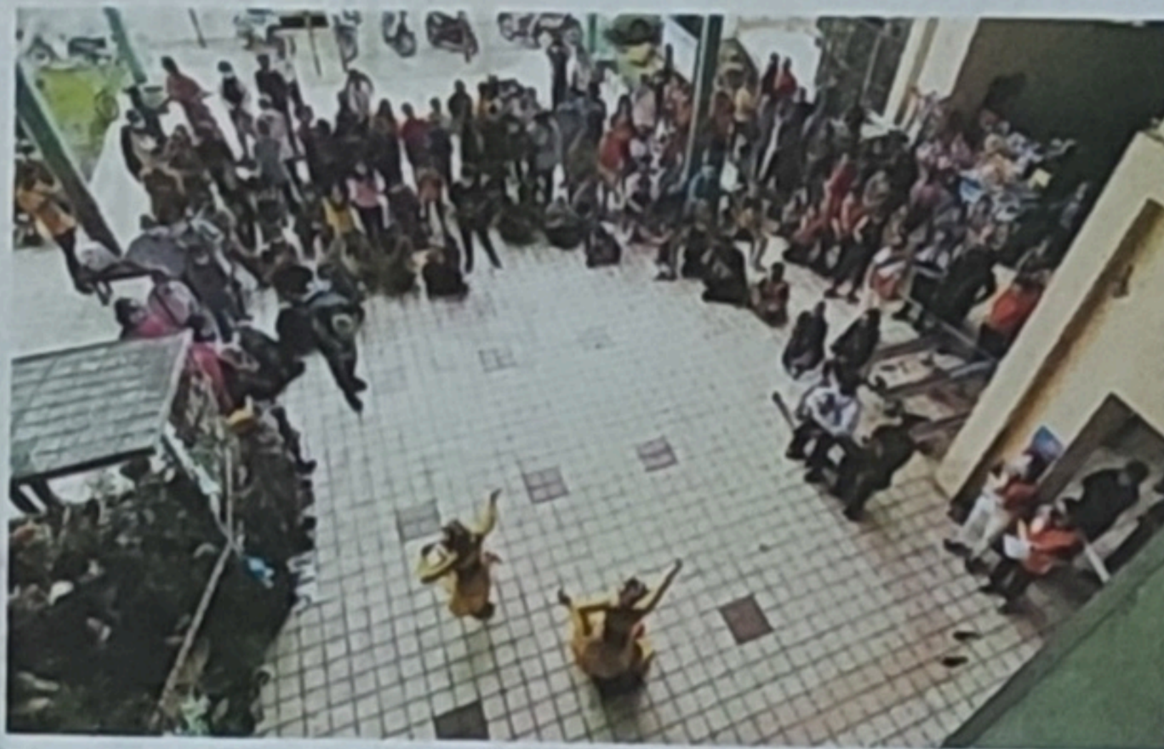
历时约半小时的户外演出,虽然时间很短,然而,4支精彩的舞蹈让围观民众报以如雷掌声,11时30分开始的户外演出,有民众於11时就在现场等候。

舞蹈,是来自吉隆坡的姬杏娜卡舞蹈团印度独舞《come hither!o krishna!》;新加坡华族舞蹈剧场《花盆底鞋》;印尼公主徽章舞蹈团《jaya perbangsa》;和菲律宾名人舞蹈团《it's showtime!》。