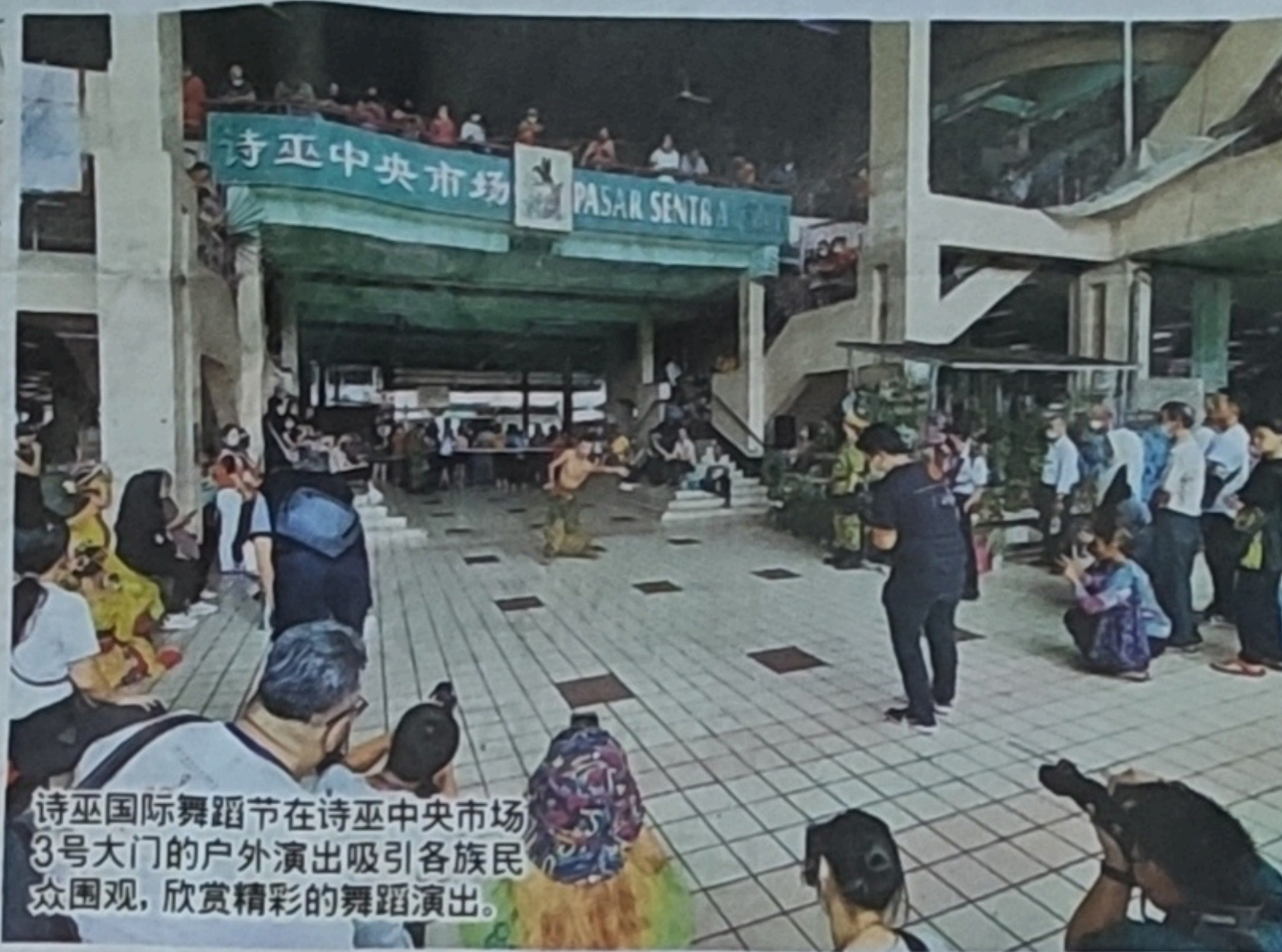
诗巫国际舞蹈节在诗巫中央市场3号大门的户外演出吸引各族民众围观,欣赏精彩的舞蹈演出。