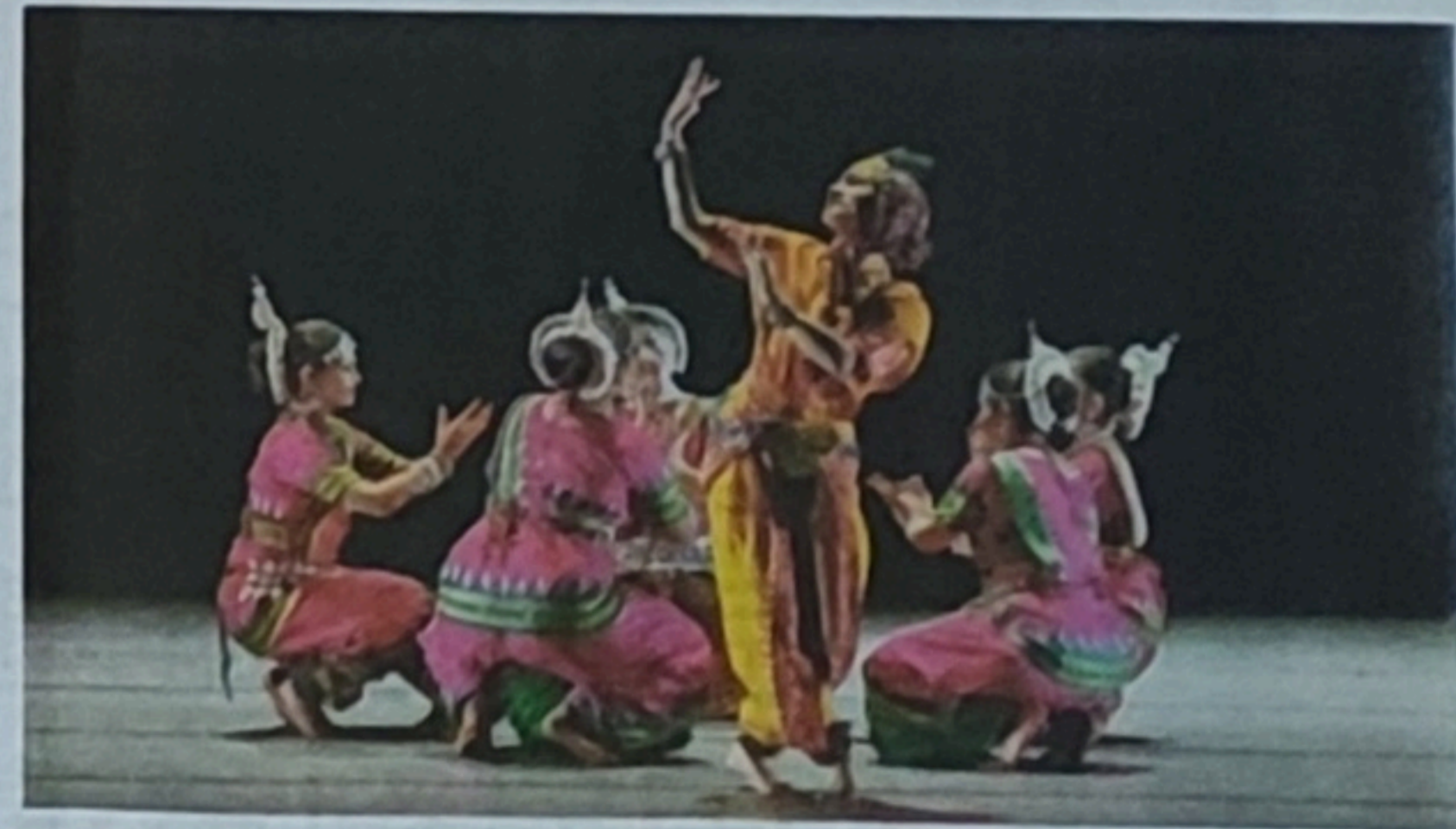
印度马杜密达瓦奥迪西舞蹈团。