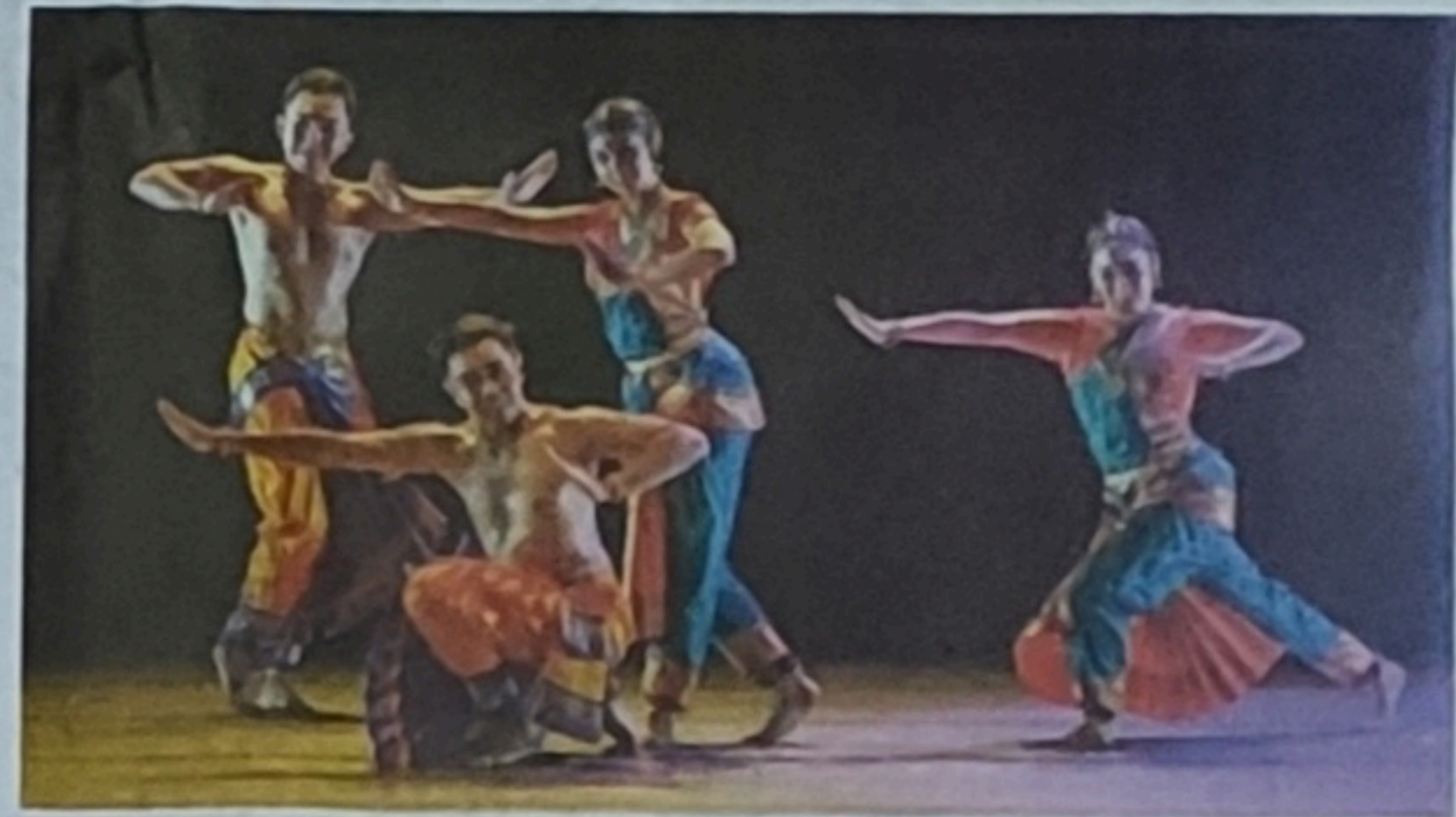
马来西亚询舞蹈团。