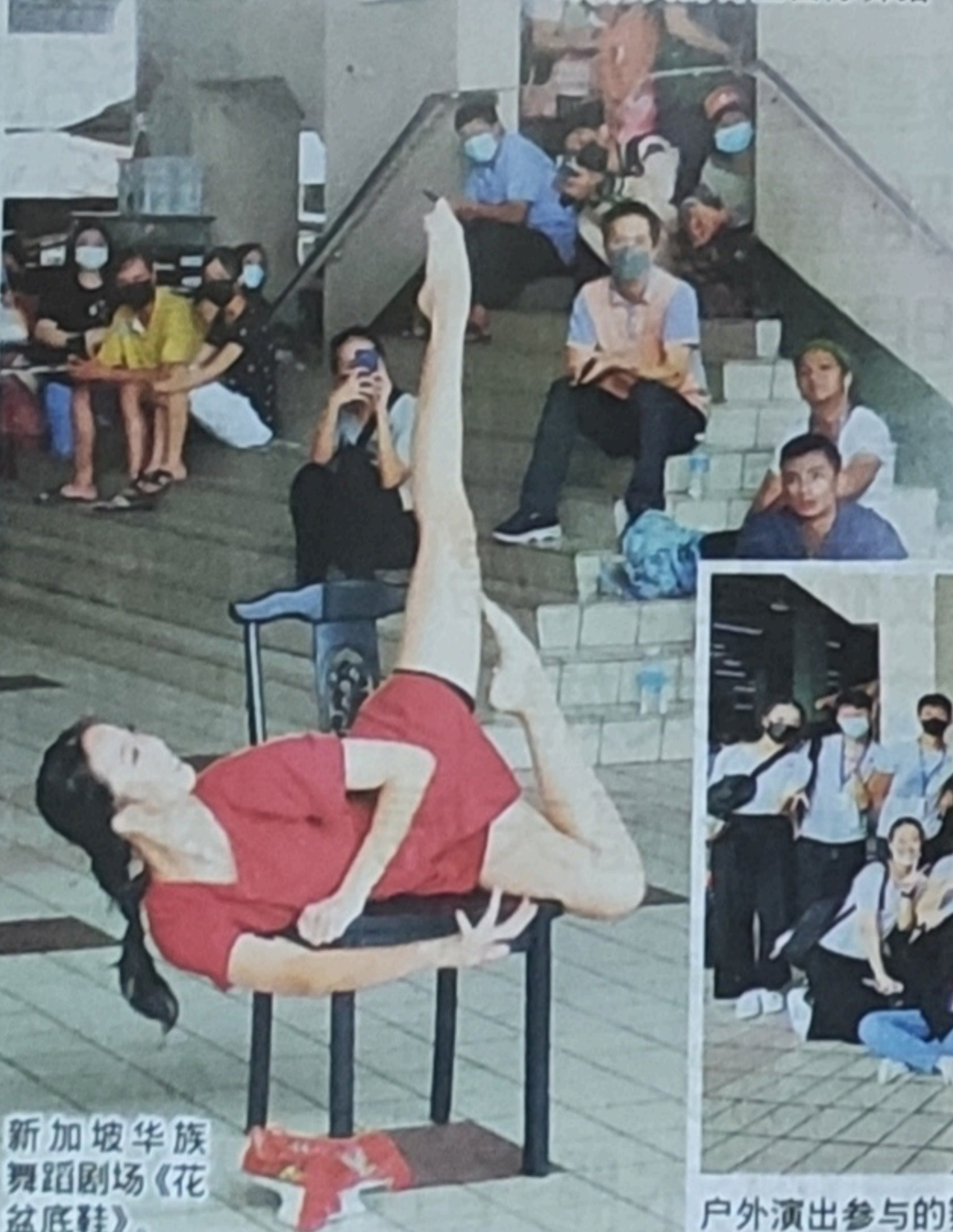
新加坡华族舞蹈剧场《花盆底鞋》。