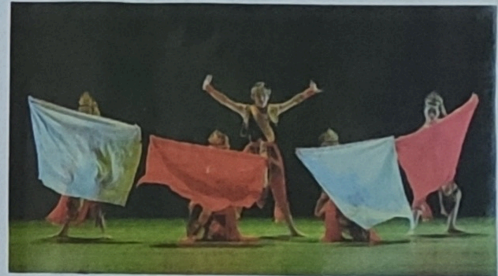
印尼公主徽章舞蹈团。